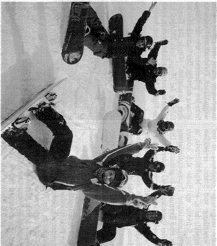
Eine tolle Woche erlebt: Ein Gruppe Snowboarder der Oberstufe Sevelen gibt ihrer Freude Ausdruck.

Über die ganze Woche verteilt nahmen die Schülerinnen und Schüler an einer speziellen Skilager-Olympiade teil. Die Vätergruppen, die sich je-